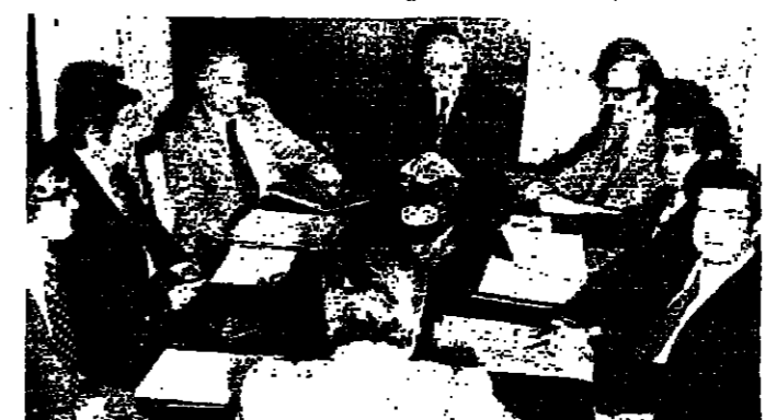
وزير الصناعة والتفط لوبس أبو شرف أثناء اجتماعه بخبراء النفط